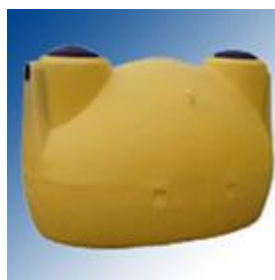
Fosa septica ovoida

Fosele septice SEBICO sunt echipate standard cu filtru.