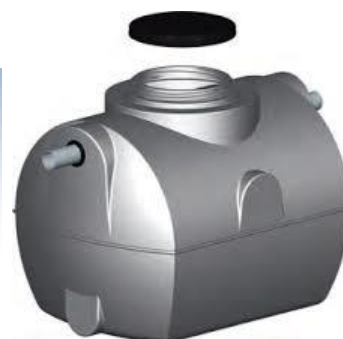
Fosa septica FAN