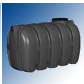
Fosa septica FAN