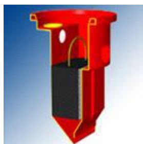
Filtru fosa septica